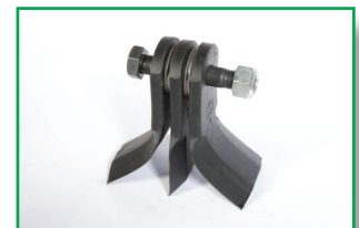
2 Coltelli a Y + 1 diritto (optional) Y shaped blades with straight blade (optional) 2 Couteaux à Y + 1 droit (optional) 2 Y-Messer und 1 gerades Messer (optional)