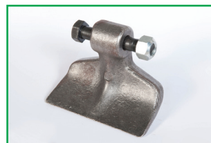
Mazza liscia (di serie) Flat hammer (standard) Masse lisse (de série) Glattschlegel (standard)