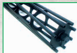
Rullo gabbia - Cage roller Rouleau cage - Stabwalze