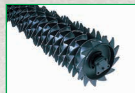
Rullo Packer - Packer roller Rouleau packer - Packerwalze