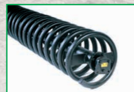
Rullo spirale - Spiral roller Rouleau spirales - Spiralwalze

Potenza massima suggerita Maximum suggested horsepower Puissance maximum suggérée Empfohlene maximale Leistung