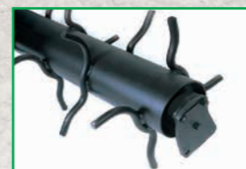
Rullo spuntoni - Spikes roller Rouleau pointes - Stachelwalze